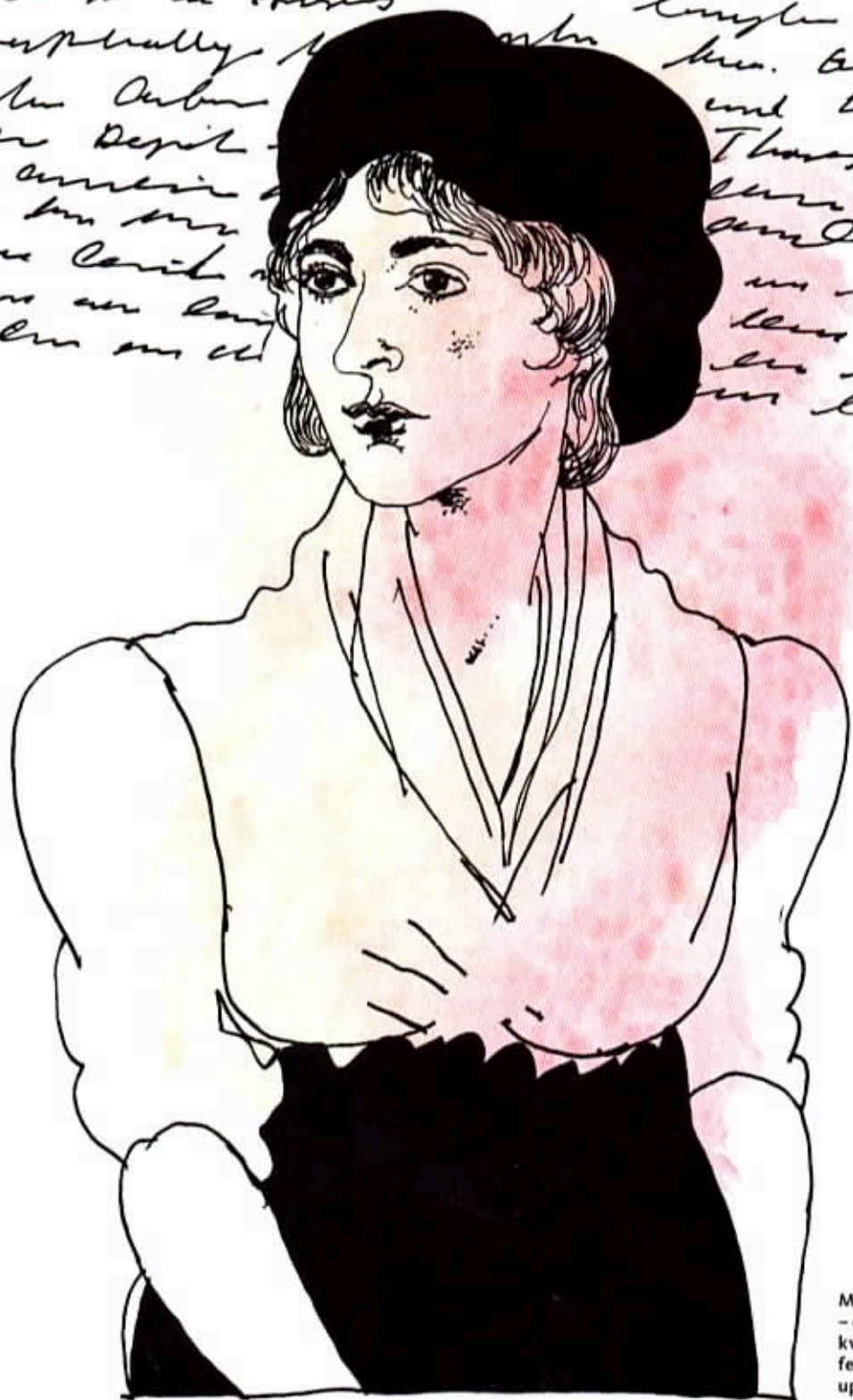
Mary Wollstonecraft - engelsk författare, kvinnoörightsaktivist, feministisk filosof och upplysningsfilosof. >>

Handwritten text in a cursive script, likely a quote or a passage from a letter or manuscript. The text is partially obscured by the illustration of Mary Wollstonecraft's head and shoulders.